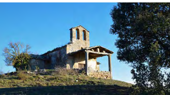
MHÀ, ESTUDI GRÀFIC · DL: 145-2023 · FOTOGRAFIES de l'arxiu de Turisme Solsonès. PORTADA: torre de Peracamps (Helena Rovira). CONTRAPORTADA: pi de Montraveta (Albert Colell); església de Santa Maria de Montraveta (Albert Colell). INTERIOR: bauma Negra (Ester Sabata); pi de Montraveta (Ester Sabata)

OFICINA DE TURISME DEL SOLSONÈS Carretera de Bassella, 1 - 25280 Solsona T. (+34) 973 48 23 10 - 623 172 497 turisme@turismesolsones.com www.turismesolsones.com @turismesolsones