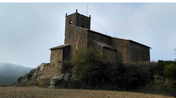
MHÀ, ESTUDI GRÀFIC · DL: 144-2023 · FOTOGRAFIES de l'arxiu de Turisme Solsonès. PORTADA: castell de Llobera (Ester Sabata). CONTRAPORTADA: roureda de la Vila (Montse Rodriguez); església de Sant Pere de Llobera (Ester Sabata). INTERIOR: trams de la ruta (Ester Sabata i Montse Rodriguez)