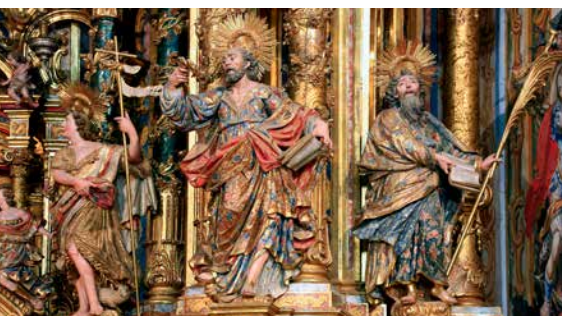
MHÀ, ESTUDI GRÀFIC · DL: L 245-2022 · FOTOGRAFIES de l'arxiu Turisme Solsonès. PORTADA: vistes del santuari del Miracle (Antoni Chaparro). CONTRA-PORTADA: santuari de Pinós (Helena Rovira); detall del retaula barroc del santuari del Miracle (J. A. Sanguinetti). INTERIOR: entorns de la masia Casacremada (Oriol Clavera – Diputació de Lleida/Ara Lleida)