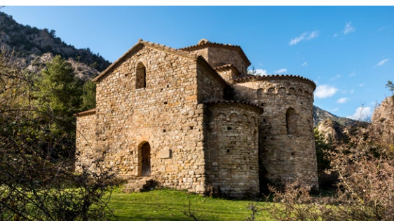
MHÀ, ESTUDI GRÀFIC · DL: L 246-2022 · FOTOGRAFIES de l'arxiu Turisme Solsonès. PORTADA: pont romànic i riu Aigua d'Ora (Ester sabata). CONTRA-PORTADA: Cal Guirre de l'Ecomuseu de la Vall d'Ora (Oscar Rodbag); Sant Pere de Graudescales (Oscar Rodbag). INTERIOR: serradora de Cal Guirre (Oscar Rodbag); Sant Pere de Graudescales (Oscar Rodbag)

i OFICINA DE TURISME DEL SOLSONÈS Carretera de Bassella, 1 - 25280 Solsona T. (+34) 973 48 23 10 - ☎ 623 172 497 turisme@turismesolsones.com www.turismesolsones.com @turismesolsones