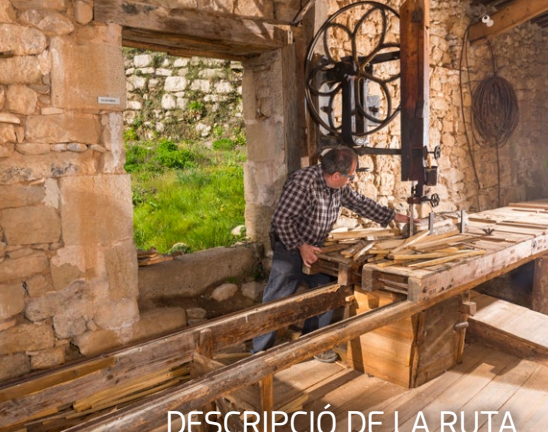
DESCRIPCIÓ DE LA RUTA