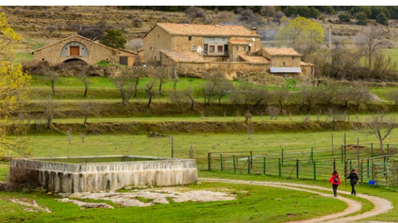
MHÀ, ESTUDI GRÀFIC · DL: L 243-2022 · PORTADA: pla i cingles de Busa. CONTRAPORTADA: palanca/pont d'accés a la presó; caminadors al pla de Busa. INTERIOR: vistes des del mirador del Capolatell.

OFICINA DE TURISME DEL SOLSONÈS Carretera de Bassella, 1 - 25280 Solsona T. (+34) 973 48 23 10 - ☎ 623 172 497 turisme@turismesolsones.com www.turismesolsones.com @turismesolsones