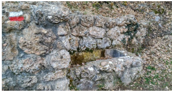
MHÀ, ESTUDI GRÀFIC · DL: L 227-2022 · FOTOGRAFIES de l'arxiu de Turisme Solsonès. PORTADA: conjunt del castell de Lladurs i església de Sant Martí (Xavier Bertolin). CONTRAPORTADA: balma de les Cambres de la Llera (Xavier Bertolin); fons de Lladurs (Ester Sabata). INTERIOR: vistes des del castell de Lladurs (Ester Sabata); creu de la Contrella (Ester Sabata)

OFICINA DE TURISME DEL SOLSONÈS Carretera de Bassella, 1 - 25280 Solsona T. (+34) 973 48 23 10 - 623 172 497 turisme@turismesolsones.com www.turismesolsones.com @turismesolsones