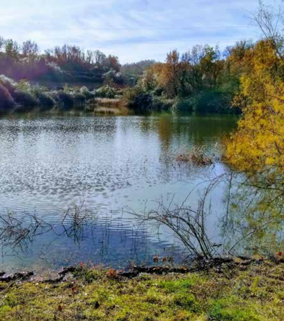
MHÀ, ESTUDI GRÀFIC · DL: L 233-2022 · FOTOGRAFIES de l'arxiu Turisme Solsonès. PORTADA: exterior del santuari del Miracle (David Guitart). CONTRAPORTADA: bassa del Miracle (Ester Sabata) INTERIOR: Casa Gran del Miracle (Ester Sabata); vinyes del Miracle (Ester Sabata)