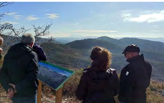
MHÀ, ESTUDI GRÀFIC · DL: L 247-2022 · FOTOGRAFIES de l'arxiu de Turisme Solsonès. PORTADA: la bassa del Coll i el poble de Prades al fons. CONTRAPORTADA: roc foradat; mirador serra del Pal. INTERIOR: tram per on transcorre la ruta