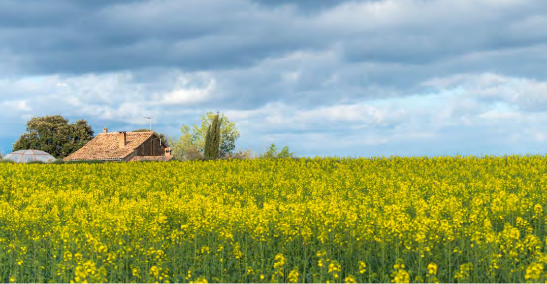
MHÀ, ESTUDI GRÀFIC · DL: L 102-2021 · PHOTOS from the Solsona Turisme and Turisme Solsonès archive. COVER: Bassa de l'Alzina (Cristina Cabestany). BACK COVER: Fields in the area around Brics (Oscar Rodbag); wildlife observation point (Cristina Cabestany). INTERIOR: Countryside of Brics (Cristina Cabestany).