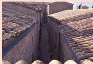
VILA CLOSA DE SANT CLIMENÇ