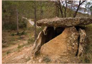
NECRÒPOLIS DE CEURÓ