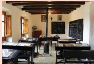
MUSEU DE L'ESCOLA RURAL