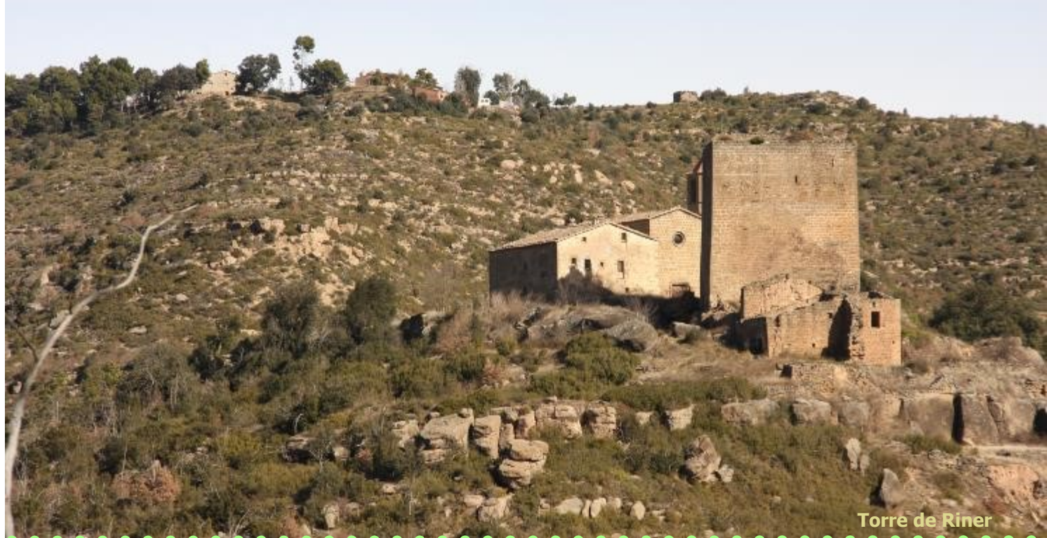
Torre de Riner

OFICINA DE TURISME DEL SOLSONÈS Centre d'interpretació turística del Solsonès Carretera de Bassella, 1 25280 Solsona Tel. (0034) 973 48 23 10 www.turismesolsones.com