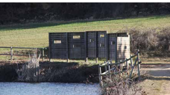
MHA, ESTUDI GRÀFIC · DL: - L 231-2022 · FOTOGRAFIES de l'arxiu Turisme Solsonès. PORTADA: embassament de l'Alzina. CONTRAPORTADA: Casa Gran del Miracle (Ester Sabata); punt d'observació de fauna aquàtica. INTERIOR: santuari del Miracle des del GR-7 (Ester Sabata); la basa de l'Alzina (Cristina Cabestany - Solsona Turisme)