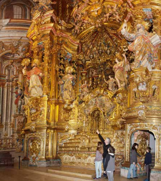
MHÀ, ESTUDI GRÀFIC · DL: L 230-2022 · FOTOGRAFIES de l'arxiu Turisme Solsonès. PORTADA: Freixinet (David Guitart). CONTRAPORTADA: retaule barroc del santuari del Miracle (David Guitart). INTERIOR: vinyes del Miracle (Ester Sabata), església de Freixinet (David Guitart); Casa Villaró (Ester Sabata)

OFICINA DE TURISME DEL SOLSONÈS Carretera de Bassella, 1 - 25280 Solsona T. (+34) 973 48 23 10 - ☎ 623 172 497 www.turismesolsones.com @turismesolsones