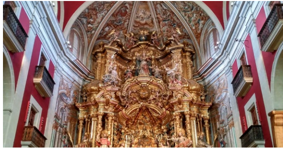
MHÀ, ESTUDI GRÀFIC · DL: L 238-2022 · FOTOGRAFIES de l'arxiu Turisme Solsonès. PORTADA: vistes a la masia Casacremada (Oriol Clavera-Ara Lleida). CONTRA-PORTADA: santuari de Pinós (J. A. Sanguinetti); retaule barroc del santuari del Miracle (Ester Sabata). INTERIOR: vistes del santuari del Miracle (Antoni Chaparro)

OFICINA DE TURISME DEL SOLSONÈS Carretera de Bassella, 1 - 25280 Solsona T. (+34) 973 48 23 10 - 623 172 497 turisme@turismesolsones.com www.turismesolsones.com @turismesolsones