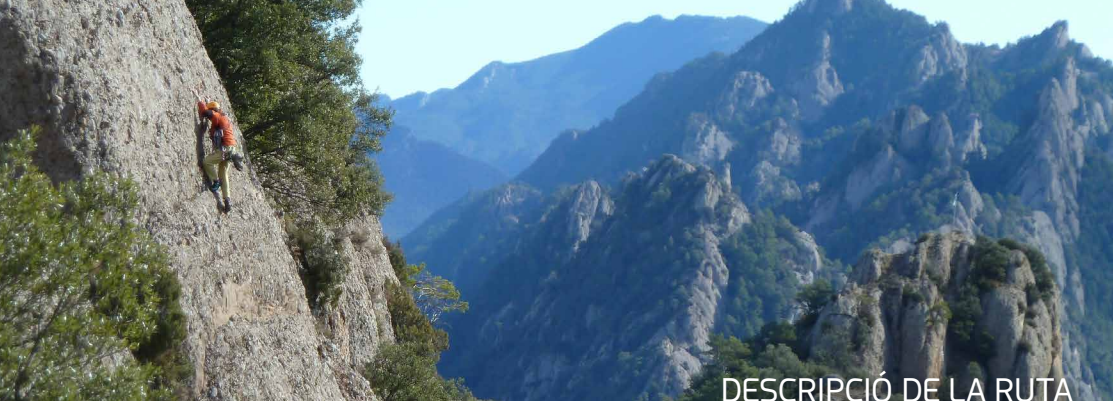
DESCRIPCIÓ DE LA RUTA