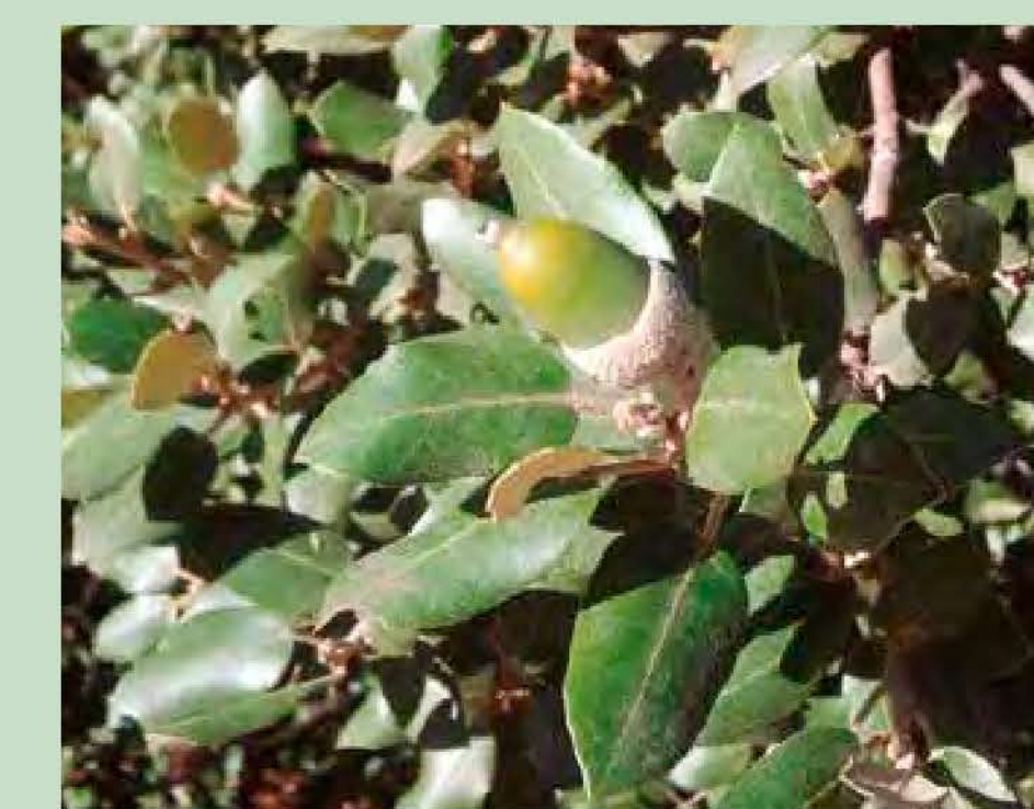
Alzina Quercus ilex