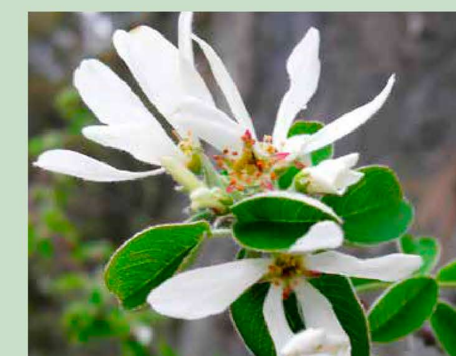
Corner Amelanchier ovalis