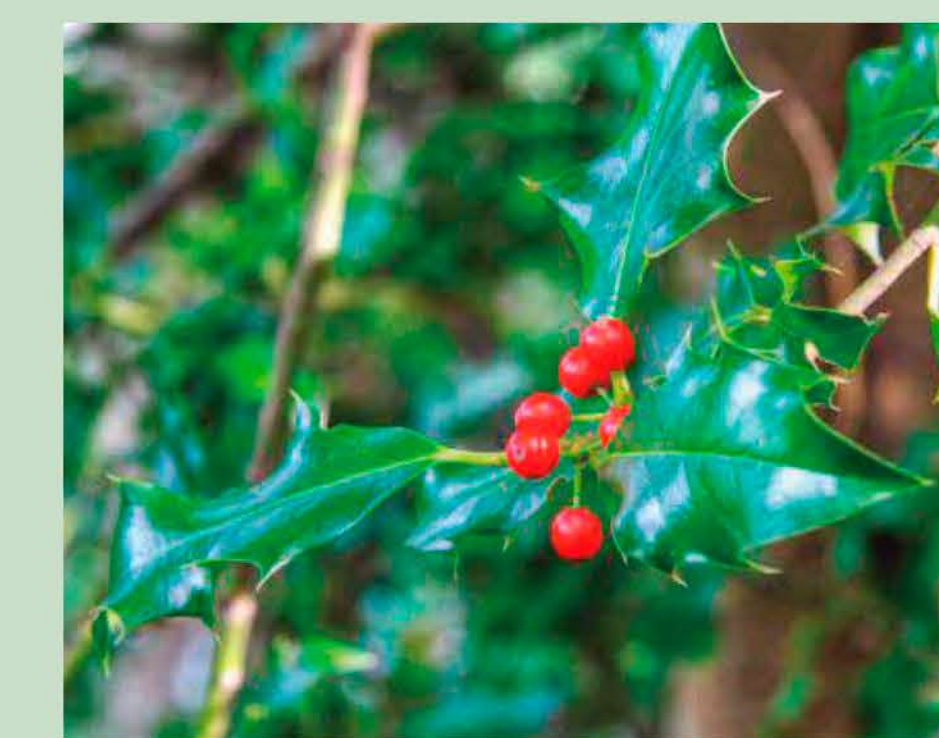
Boix grèvol Ilex aquifolium