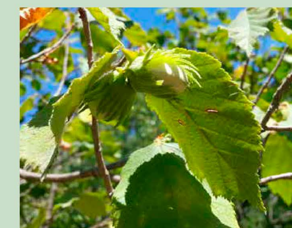
Avellaner Corylus avellana