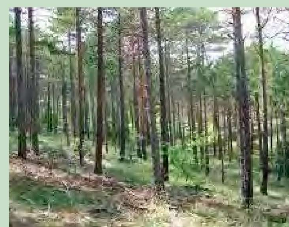
Pinassa Pinus nigra salzmannii

Aquest espai està dominat gairebé tot per pinedes de pinassa ( Pinus nigra salzmannii ), que es troben en un bon estat de conservació i tenen en aquestes obagues una de les seves millors representacions. El sotabosc està constituït per matollar predominantment de boix ( Buxus sempervirens ) encara que també hi ha espècies com el corner ( Amelanchier ovalis ) o l'avellaner ( Corylus avellana ). Sovint apareix barrejat amb roure de fulla petita ( Quercus faginea ) i a vegades amb alguna altra de frondosa, com l'alzina ( Quercus ilex ), o la blada ( Acer opalus ). Aquest espai és també un bon representant de la fauna forestal, amb una típica influència mediterrània a causa del seu bon estat de conservació.