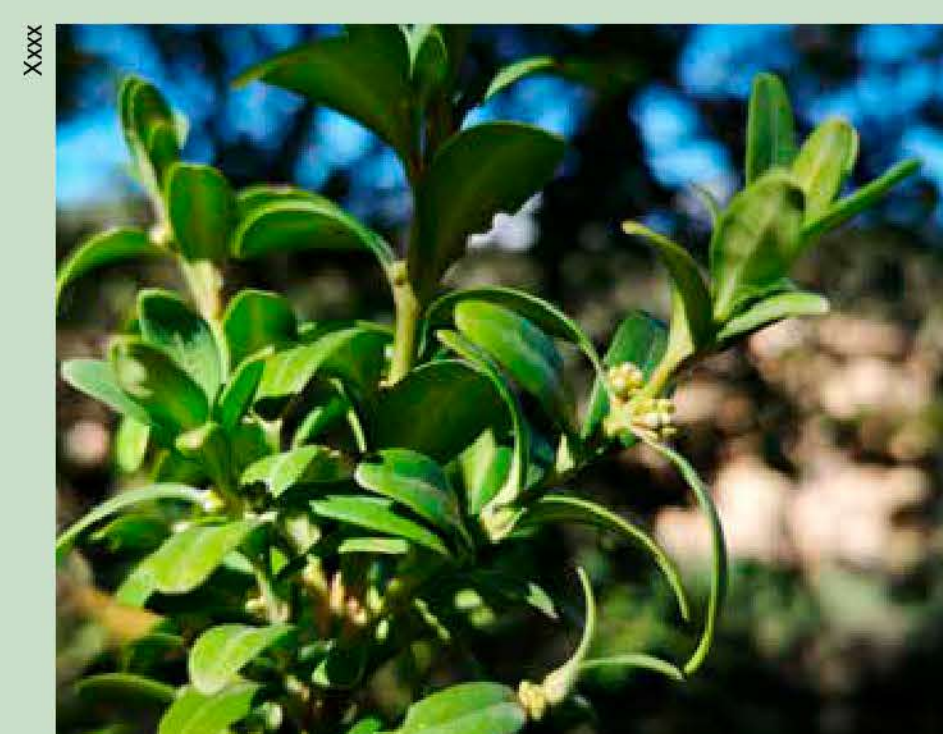
Boix Buxus sempervirens