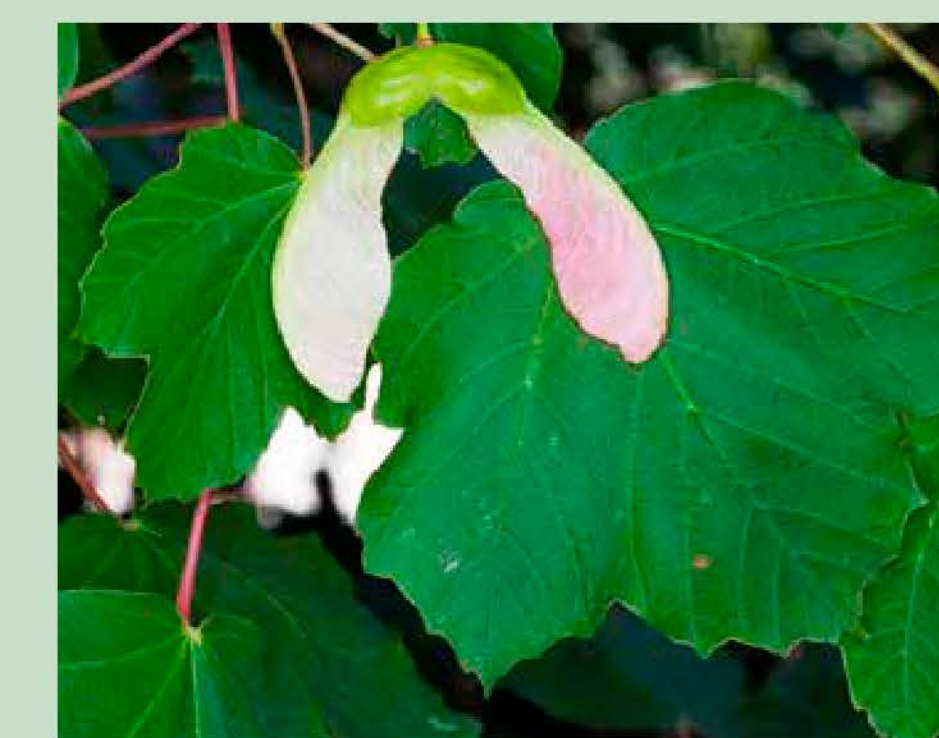
Blada Acer opalus