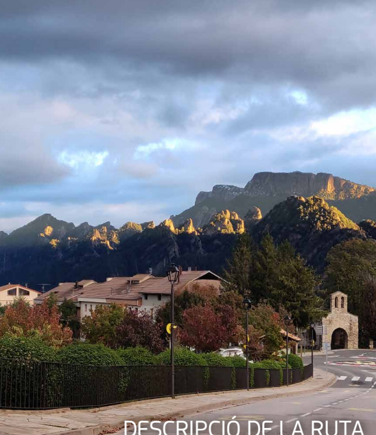
DESCRIPCIÓ DE LA RUTA