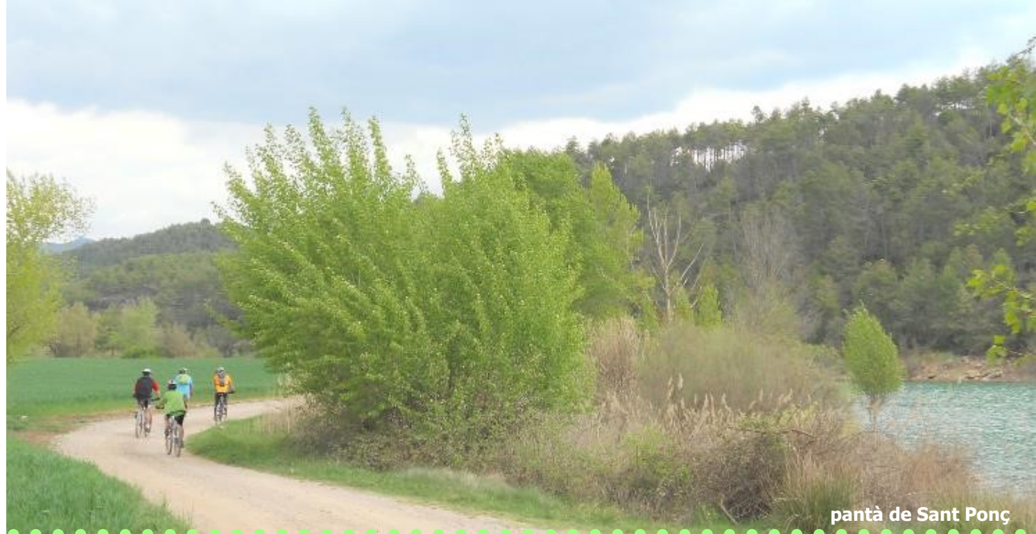
pantà de Sant Ponç