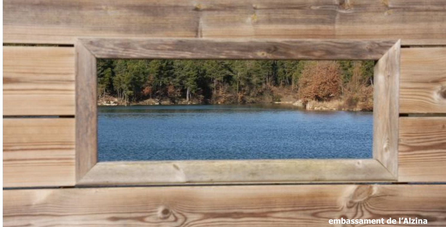
embassament de l'Alzina

OFICINA DE TURISME DEL SOLSONÈS Centre d'interpretació turística del Solsonès Carretera de Bassella, 1 25280 Solsona Tel. (0034) 973 48 23 10 www.turismesolsones.com